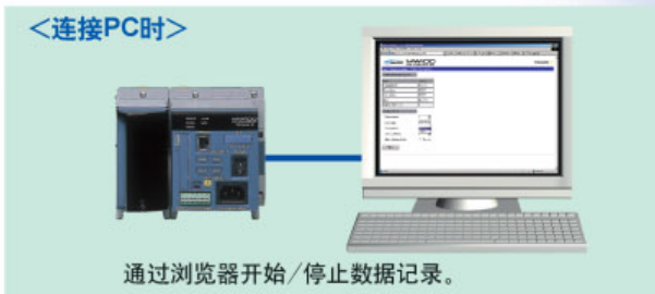
通过浏览器开始/停止数据记录。