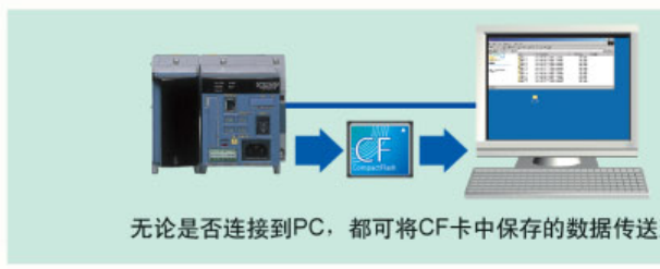
无论是否连接到PC, 都可将CF卡中保存的数据传送到PC。