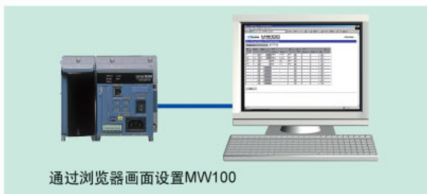
通过浏览器画面设置MW100