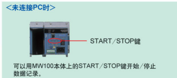
可以用MW100本体上的START/STOP键开始/停止数据记录。

测量数据保存到MW100内插入的CF卡中。 无论是否连接到PC, 都可执行数据记录的开始/停止操作。