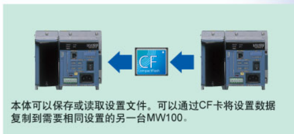
本体可以保存或读取设置文件。可以通过CF卡将设置数据复制到需要相同设置的另一台MW100。