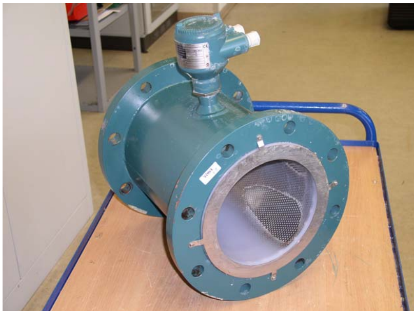
Bild AXF abrasiv: Magnetisch-induktiver Durchflussmesser mit PFA-Auskleidung nach längerem Einsatz mit abrasiven Medien; deutlich erkennbar das Lochblech, welches zur Verstärkung der Auskleidung mit eingegossen wurde

Die Art der Beschichtung ist natürlich nicht das einzige Auswahlkriterium für das Messrohr eines MID. Die Beschaffenheit der Elektroden und der Erdungsringe ist je nach Messanforderung von großer Bedeutung. Wenn man hier beispielsweise die breite Produktpalette von Yokogawa sieht, bekommt man einen Eindruck von den vielfältigen Einsatzmöglichkeiten. Auch die Elektronik ist ein wichtiger Auswahlparameter – hier bietet der Markt viele Varianten von „ganz schlicht“ bis „raffiniert“. Yokogawa bietet beim ADMAG AXF standardmäßig neben vielen anderen Features zum Beispiel eine Funktion, die automatisch Ablagerungen im Messrohr erkennt. Zunehmend legen Anwender auch Wert auf einfache und zuverlässige Integration in Prozessumgebungen, was das genannte Gerät neben Puls- und Stromausgang mit HART, BRAIN und Foundation Fieldbus realisiert. Die richtige Auslegung eines MID ist zwar keine Geheimwissenschaft, aber wie bei allen wichtigen Feldgeräten heißt es auch hier: Eine gründliche Beratung durch Fachleute lohnt sich!